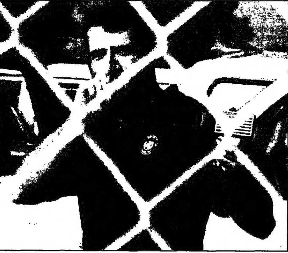
مفتش أمريكي ضمن أعضاء اللجنة الخاصة في بغداد أمس

■ دمام - رويترز: رحب الملك فهد عامل السعودية أمس الاثنين بتصوية أزمة مفتشي الأمم المتحدة في العراق بطريقة سلمية. وذكرته وكالة الأنباء السعودية في تقريرها عن الاجتماع الاسبوعي لمجلس الوزراء ان الملك فهد الذي رأس الاجتماع أعرب عن رضاه التام عن الطريقة التي انتهت بها الأزمة بين العراق والامم المتحدة.